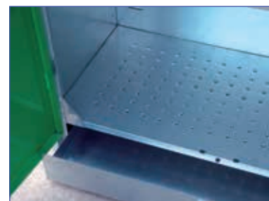
Bacino di raccolta sul fondo